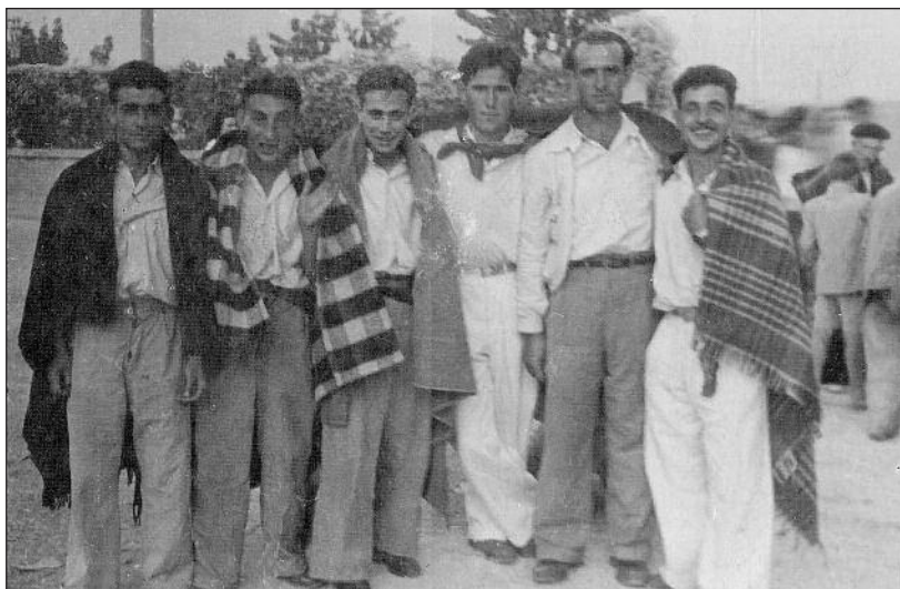
FOTOS PARA EL RECUERDO.- Un grupo de amigos en las inmediaciones de La Chata. Año: 1949. (Comentario en la Sección "Notas Arandinas").