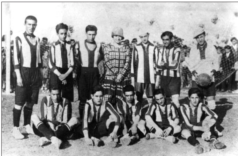
FOTOS PARA EL RECUERDO. Los primeros futbolistas de Aranda de Duero . Año: 1923. (Comentario en la sección Notas Arandinas).

C/ Las Boticas 7, en pleno centro de Aranda Tel. 947 50 00 72