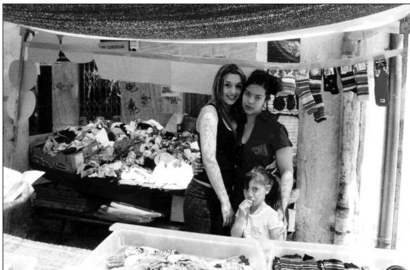
FOTOS PARA EL RECUERDO.- El último mercado de la plaza Mayor. Año: 2009. (Comentario en la Sección "Notas Arandinas").