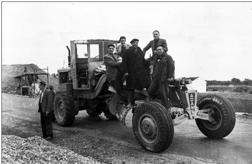
FOTOS PARA EL RECUERDO.- Obras iniciales del Polígono Industrial Allende Duero. Año: 1966. (Comentario en la Sección "Notas Arandinas").