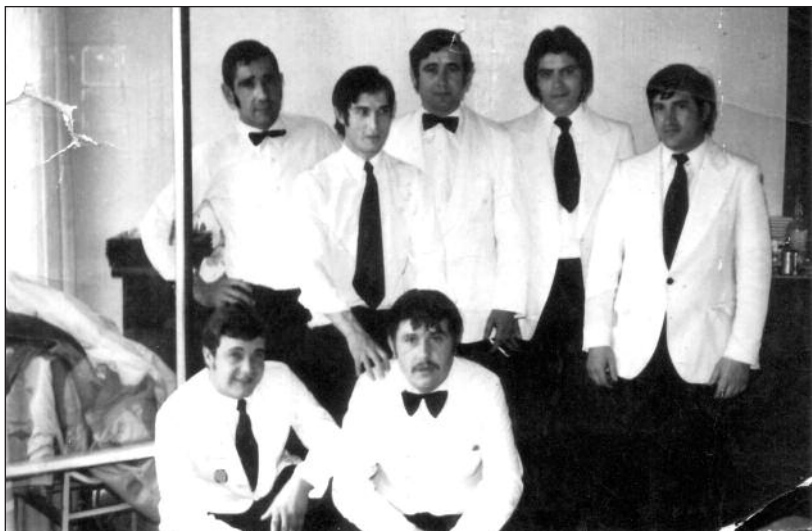
FOTOS PARA EL RECUERDO.- Camareros del Restaurante de las Piscinas Acapulco. Año 1975. (Comentario en la Sección "Notas Arandinas").

Inglés / Francés / Alemán... Lengua - Sociales... Profesores nativos