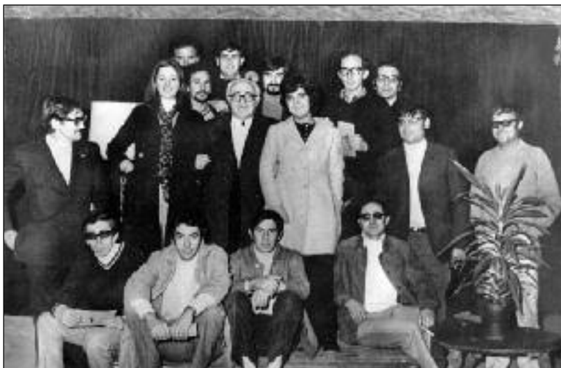
FOTOS PARA EL RECUERDO.- Recital del guitarrista Segundo Pastor. Año 1973. (Comentario en Portada)

Antonio y Manuel Cebas, 5 - 2.º B • ARANDA Tels. 91 579 42 49 • 947 50 09 48