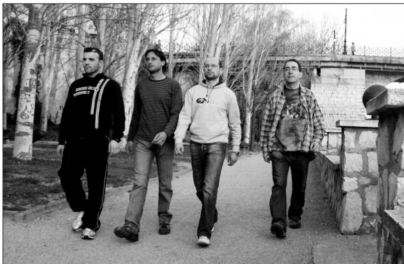
FOTOS PARA EL RECUERDO.- Componentes del grupo de rock metal arandino En la sombra. Año: 2008. (Comentario en la Sección "Notas Arandinas").