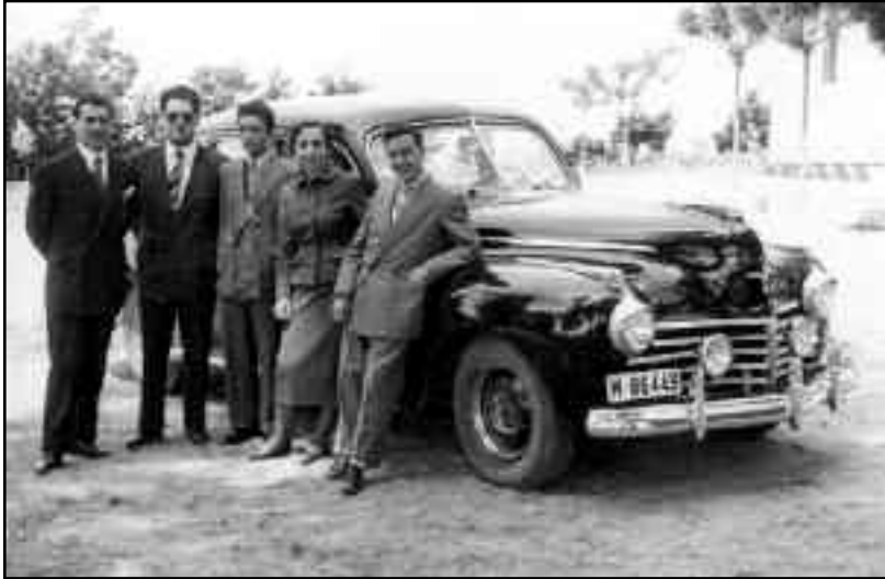
FOTOS PARA EL RECUERDO.- Empleados y familiares de la empresa "Juan Figuro Monzón". Hacia 1965. (Comentario en la Sección "Notas Arandinas").