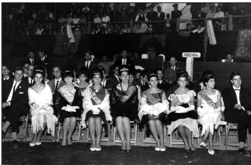
FOTOS PARA EL RECUERDO.- V Festival Hispano-Portugués de la Canción del Duero. Año 1964. (Comentario en la Sección "Notas Arandinas").

Antonio y Mammel Cebas, 5 - 2.ª B • ARANDA Tels. 91 579 42 49 • 947 50 09 48