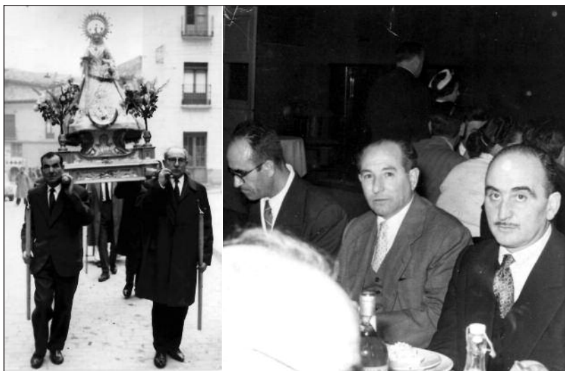
FOTOS PARA EL RECUERDO.- Procesión de la Patrona del Servicio Municipal de Aguas. Año: 1965. (Comentario en la Sección "Notas Arandinas").