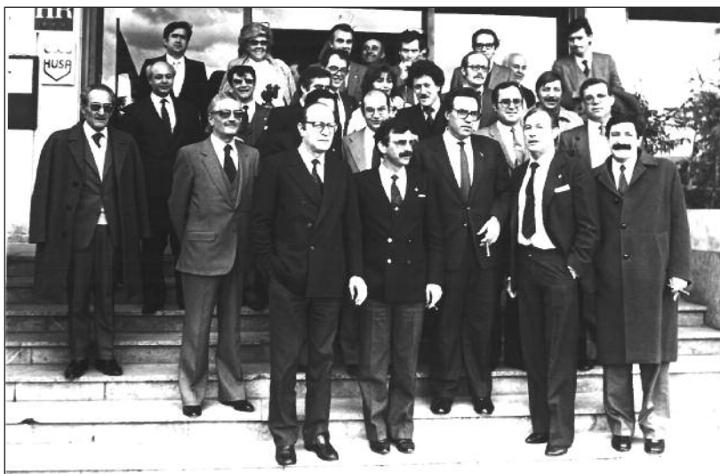
FOTOS PARA EL RECUERDO.- Visita de Gregorio Peces-Barba a Aranda de Duero. Año: 1984. (Comentario en la Sección "Notas Arandinas").

El contenido de la publicación no refleja necesariamente la opinión del editor.