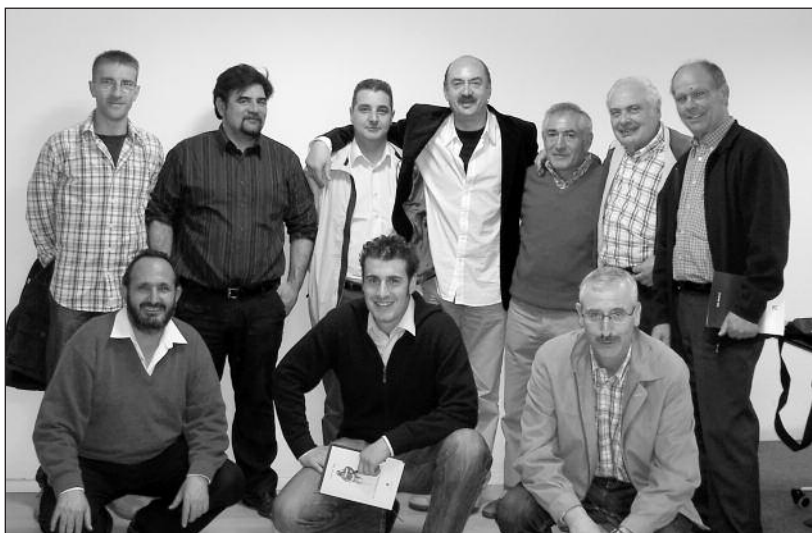
FOTOS PARA EL RECUERDO.- Grupo de poetas en la Ribera del Duero. Año: 2008. (Comentario en la Sección "Notas Arandinas").

El contenido de la publicación no refleja necesariamente la opinión del editor.