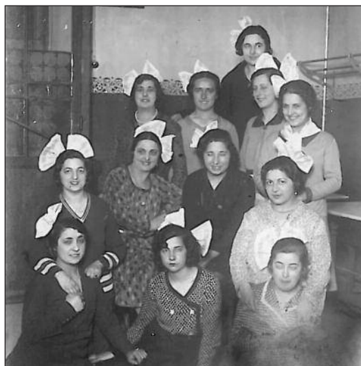
FOTOS PARA EL RECUERDO.- Un grupo de amigas arandinas. Año: 1930. (Comentario en la Sección "Notas Arandinas").