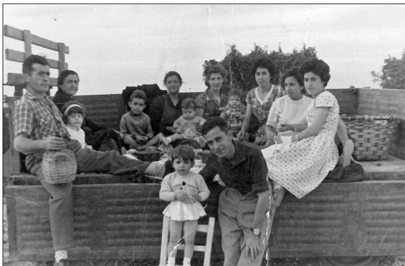
FOTOS PARA EL RECUERDO.- En la romería de San Pedro. Año: 1963. (Comentario en la Sección "Notas Arandinas").