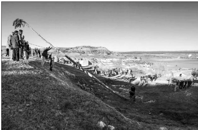
FOTOS PARA EL RECUERDO.- Levantando el Mayo en San Martín de Rubiales. Año: 2016. (Comentario en la Sección "Notas Arandinas").