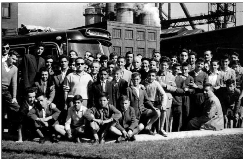
FOTOS PARA EL RECUERDO. Alumnos de la Escuela de Artes y Oficios en un viaje a Bilbao. Año: 1961. (Comentario en la sección Notas Arandinas).