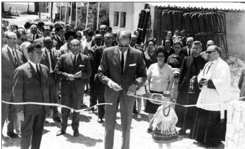
FOTOS PARA EL RECUERDO.- Inauguración de las Piscinas Costaján. Año 1968. (Comentario en la Sección "Notas Arandinas").

Pol. Ind. Allenduedero Ctra. Valladolid, 46 Tel. 947 50 16 54