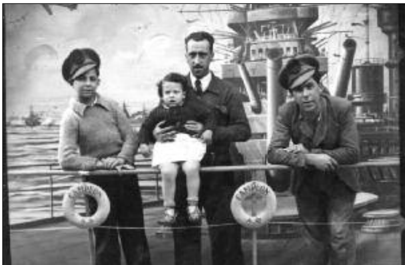
FOTOS PARA EL RECUERDO.- "La Armada española" en el río Duero. Año 1942. (Comentario en Portada).

* Ortodoncia y Ortodoncia Invisible * Cirugía Avanzada * Endodoncia * Periodoncia * Implantes Dentales * Odontología General * Odontopediatría * Estética Dental