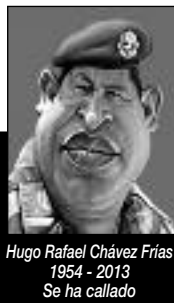
Hugo Rafael Chávez Frías 1954 - 2013 Se ha callado

www.carteleraarandina.com info@carteleraarandina.com