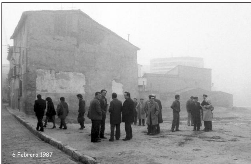
6 Febrero 1987

El contenido de la publicación no refleja necesariamente la opinión del editor.