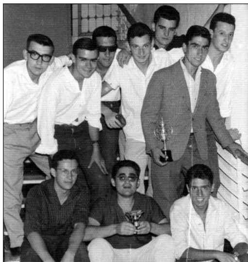
FOTOS PARA EL RECUERDO.- Pruebas de Natación de las fiestas arandinas del 7 de agosto. Año 1962. (Comentario en la Sección "Notas Arandinas").

El contenido de la publicación no refleja necesariamente la opinión del editor.