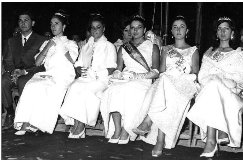
FOTOS PARA EL RECUERDO.- Reina y damas en el Festival Hispano-Portugués de la Canción del Duero. Año: 1968. (Comentario en la Sección "Notas Arandinas").

C/ Las Boticas 7, en pleno centro de Aranda Tel. 947 50 00 72