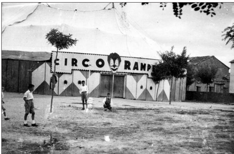
FOTOS PARA EL RECUERDO.- El Circo Ramper en las Fiestas de Aranda. Año: h. 1955. (Comentario en la Sección "Notas Arandinas").

El contenido de la publicación no refleja necesariamente la opinión del editor.