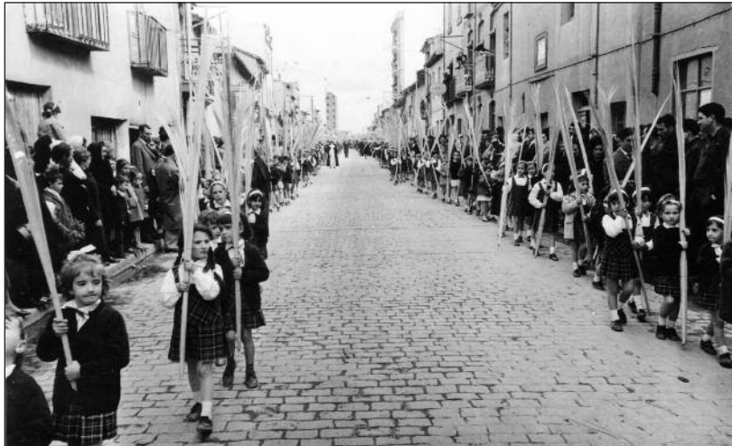
FOTOS PARA EL RECUERDO.- Domingo de Ramos. Año: 1963. (Comentario en la Sección "Notas Arandinas").

El contenido de la publicación no refleja necesariamente la opinión del editor.