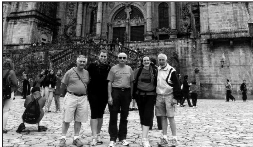
FOTOS PARA EL RECUERDO.- Grupo de arandinos tras finalizar el Camino de Santiago. Año 2012. (Comentario en la Sección "Notas Arandinas").

El contenido de los artículos y publicidad no refleja necesariamente la opinión y responsabilidad del editor.