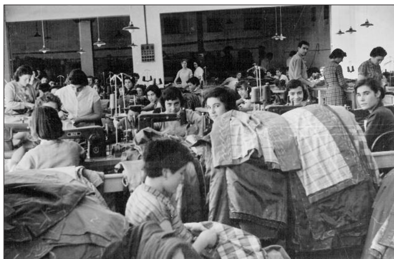
FOTOS PARA EL RECUERDO.- Trabajadoras de la fábrica de Moradillo. Año: 1957. (Comentario en la Sección "Notas Arandinas").