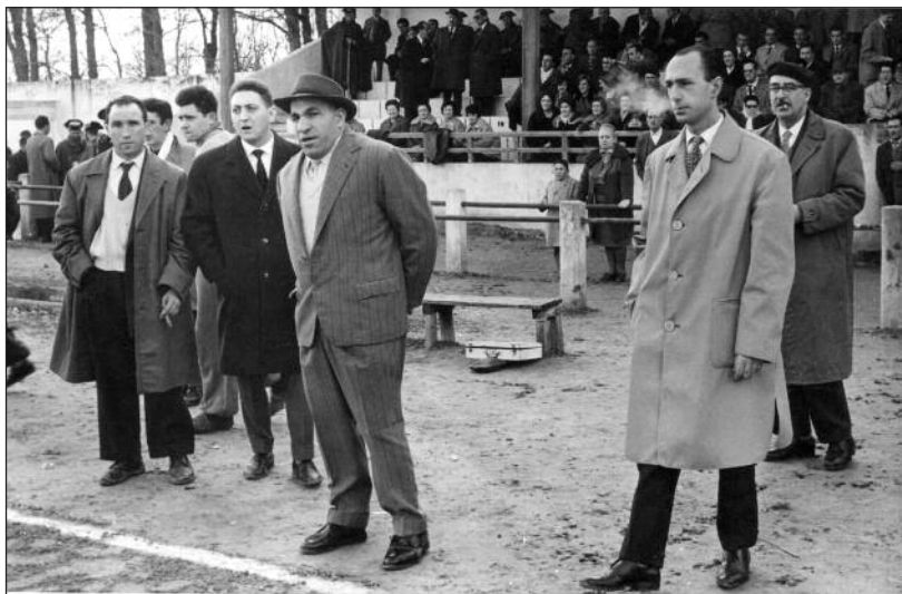
FOTOS PARA EL RECUERDO. El Torito Arandino en el campo deportivo de Educación y Descanso. Año: 1960. (Comentario en la sección Notas Arandinas).

C/ Las Boticas 7, en pleno centro de Aranda Tel. 947 50 00 72