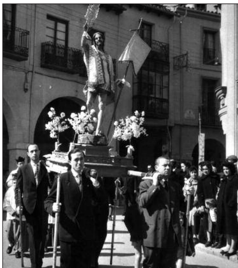
FOTOS PARA EL RECUERDO.- Domingo de Resurrección. Año: 1960. (Comentario en la Sección "Notas Arandinas").