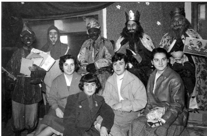
FOTOS PARA EL RECUERDO.- Los Reyes Magos en Radio Juventud de Aranda. Año: h. 1960. (Comentario en la Sección "Notas Arandinas").