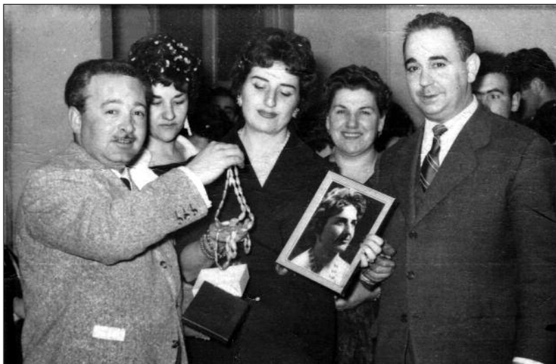
FOTOS PARA EL RECUERDO.- Ganadores de un sorteo en el Palace en Aranda. Año: 1960. (Comentario en la Sección “Notas Arandinas”).