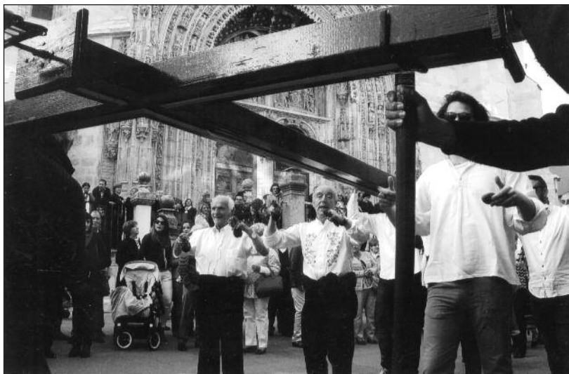
FOTOS PARA EL RECUERDO. Celebración de la Cruz de Mayo. Año: 2015. (Comentario en la sección Notas Arandinas).

C/ Las Boticas 7, en pleno centro de Aranda Tel. 947 50 00 72