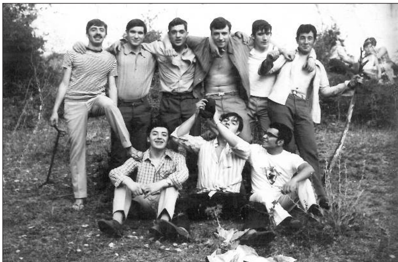
FOTOS PARA EL RECUERDO. Un grupo de amigos celebrando el día de San Pedro. Año: 1969. (Comentario en la sección Notas Arandinas).

C/ Las Boticas 7, en pleno centro de Aranda Tel. 947 50 00 72