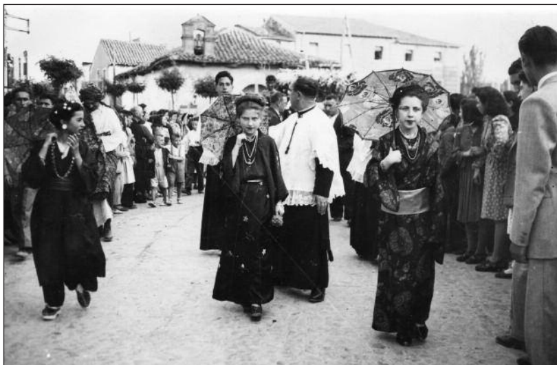
FOTOS PARA EL RECUERDO. Desfile popular a su paso por los Jardines de Don Diego . Año: 1955. (Comentario en la sección Notas Arandinas).

C/ Las Boticas 7, en pleno centro de Aranda Tel. 947 50 00 72