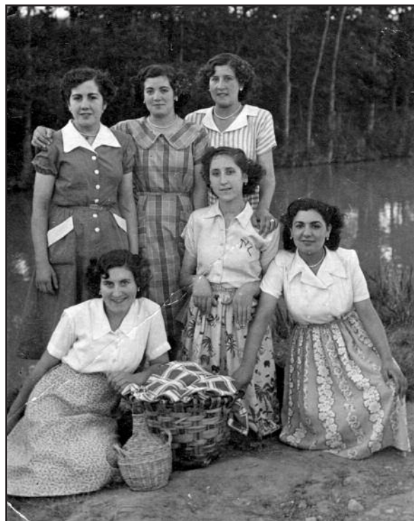
FOTOS PARA EL RECUERDO.- En la ribera del Arandilla. Hacia 1955. (Comentario en la Sección "Notas Arandinas").

El contenido de los artículos y publicidad no refleja necesariamente la opinión y responsabilidad del editor.