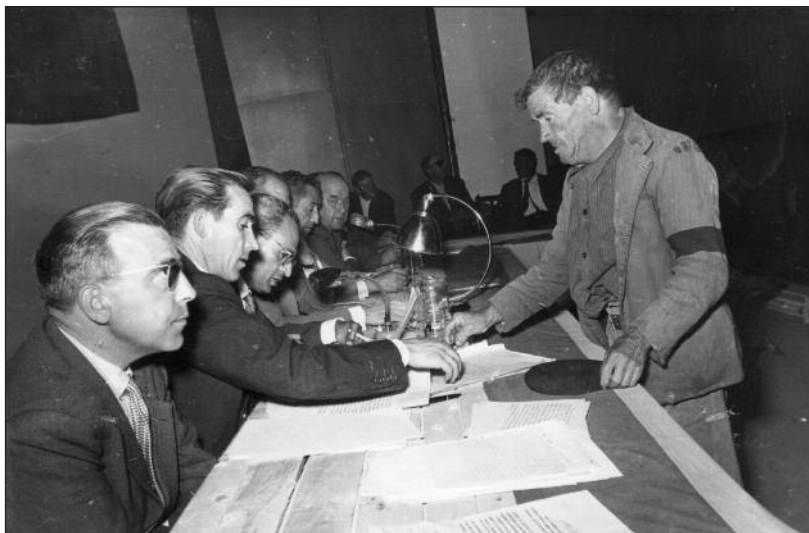
FOTOS PARA EL RECUERDO. Entrega de tierras al Ayuntamiento de Aranda para la creación del Polígono Industrial. Año: 1959. (Comentario en la sección Notas Arandinas).

C/ Las Boticas 7, en pleno centro de Aranda Tel. 947 50 00 72