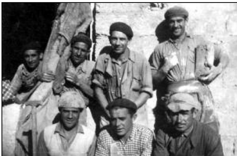
FOTOS PARA EL RECUERDO.- Trabajadores de la Fábrica de Mosaicos "Jotazeda". Año 1957. (Comentario en la Sección "Notas Arandinas")