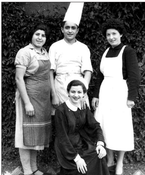
FOTOS PARA EL RECUERDO.- Empleados del Albergue de Turismo de Aranda. Año: 1954. (Comentario en la Sección "Notas Arandinas").