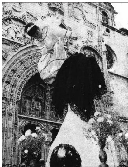
FOTOS PARA EL RECUERDO. La Bajada del Ángel de Aranda de Duero . Año: 1970. (Comentario en la sección Notas Arandinas).

El contenido de la publicación no refleja necesariamente la opinión del editor.