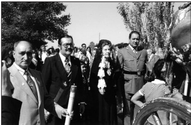
FOTOS PARA EL RECUERDO.- En la Procesión de la Virgen de las Viñas. Año 1977. (Comentario en la Sección "Notas Arandinas").

Antonio y Mamel Cebas, 5 - 2.ª B • ARANDA Tels. 91 579 42 49 • 947 50 09 48