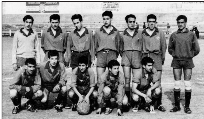
FOTOS PARA EL RECUERDO.- Club de Fútbol América. Año 1959. (Comentario en la Sección "Notas Arandinas").

El contenido de los artículos y publicidad no refleja necesariamente la opinión y responsabilidad del editor.