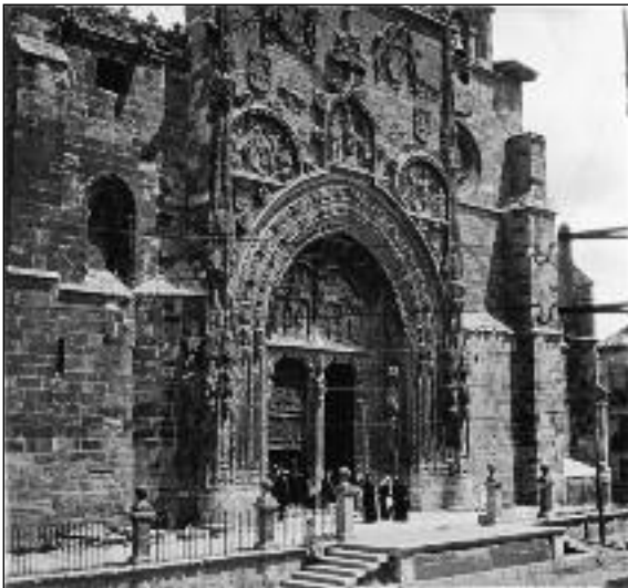
FOTOS PARA EL RECUERDO.- La Iglesia de Santa María la Real. Año 1921. (Comentario en Portada)

Antonio y Manuel Cebas, 5 - 2.º B • ARANDA Tels. 91 579 42 49 • 947 50 09 48