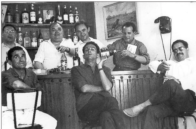
FOTOS PARA EL RECUERDO. En la Peña Facultades. Año: 1968. (Comentario en la sección Notas Arandinas).

C/ Las Boticas 7, en pleno centro de Aranda Tel. 947 50 00 72