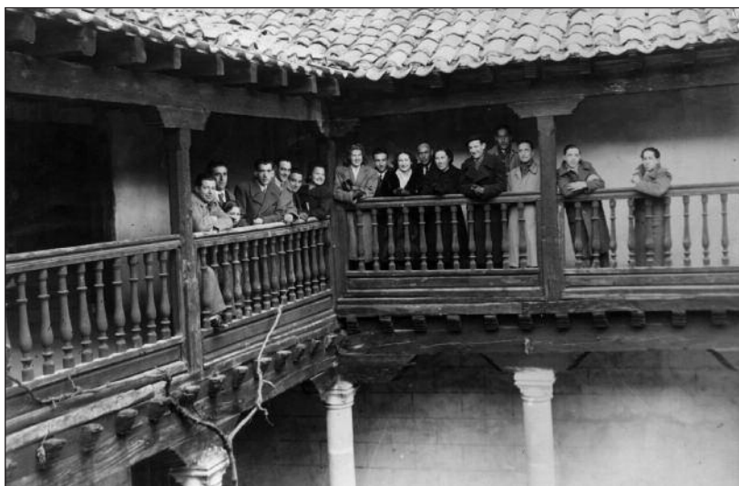
FOTOS PARA EL RECUERDO.- Grupo zarzuelero arandino. Año: 1943. (Comentario en la Sección "Notas Arandinas").