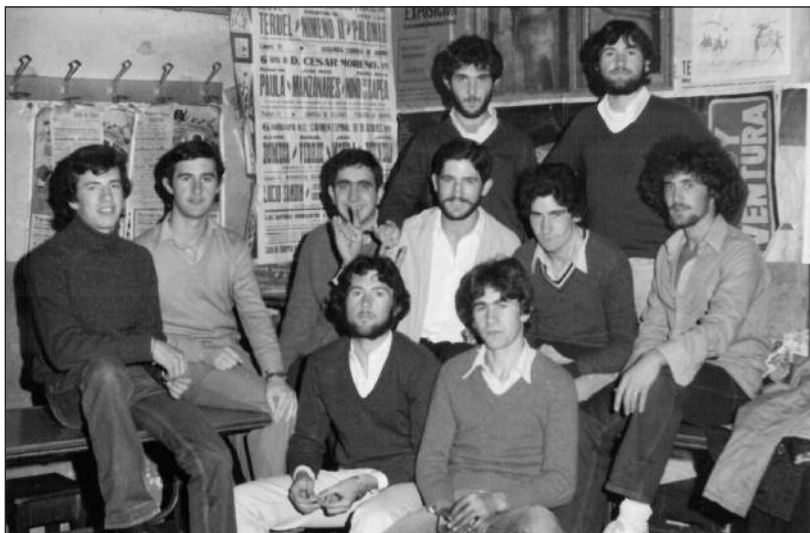
FOTOS PARA EL RECUERDO.- Una cuadrilla de amigos en el Bar La Terraza. Año: 1977. (Comentario en la Sección "Notas Arandinas").

El contenido de la publicación no refleja necesariamente la opinión del editor.