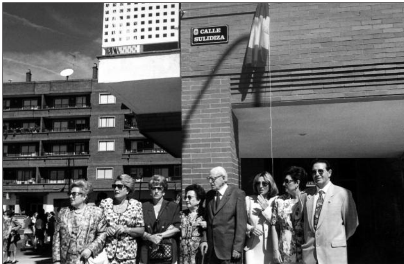
FOTOS PARA EL RECUERDO.- Inauguración de la calle "Sulidiza". Año: 1996. (Comentario en la Sección "Notas Arandinas").