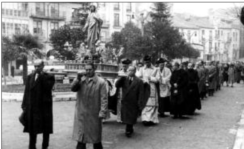
FOTOS PARA EL RECUERDO.- Procesión del Corazón de María. Años sesenta. (Comentario en la Sección "Notas Arandinas")