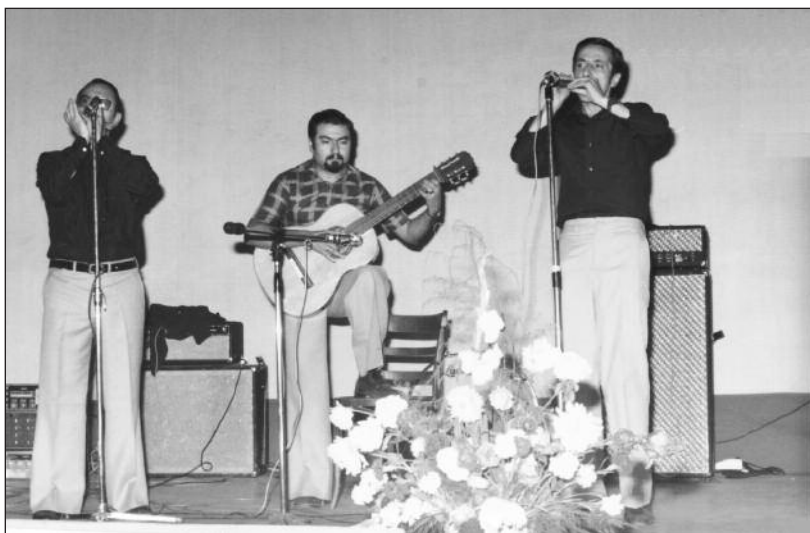
FOTOS PARA EL RECUERDO.- Trío musical en el Teatro-Cine Aranda. Año: 1978. (Comentario en la Sección "Notas Arandinas").

El contenido de la publicación no refleja necesariamente la opinión del editor.