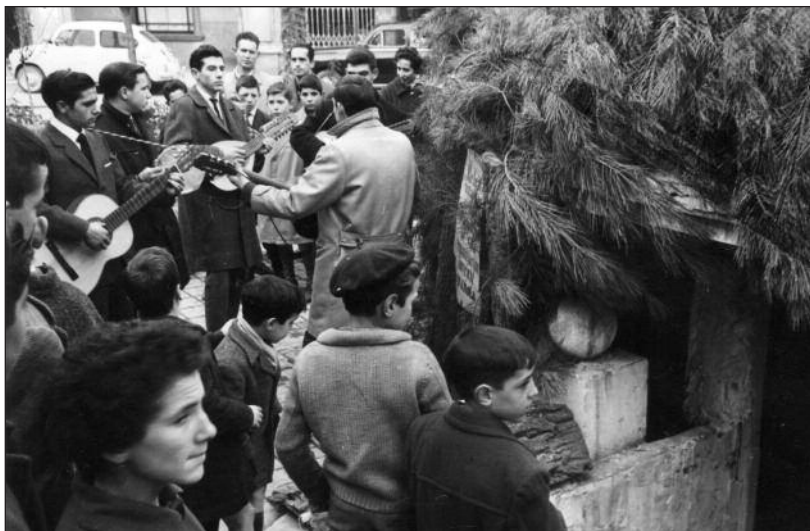
FOTOS PARA EL RECUERDO.- Visitando el belén en la Plaza Mayor. Hacia 1960. (Comentario en la Sección "Notas Arandinas").

Pol. Ind. Allendeduero Ctra. Valladolid, 46 Tel. 947 50 16 54