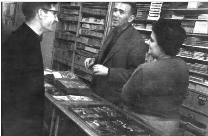
FOTOS PARA EL RECUERDO.- Librería Bayo. Año: h. 1955. (Comentario en la Sección "Notas Arandinas").

Centro Comercial Isilla - Local 17 Tel. 947 51 05 94 - Aranda