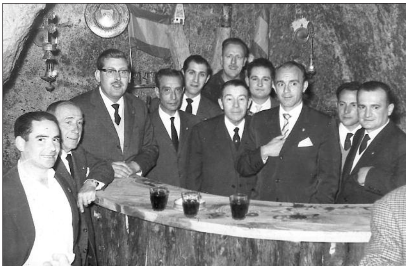
FOTOS PARA EL RECUERDO.- El mítico futbolista Alfredo Di Stéfano en Aranda. Año: h. 1960. (Comentario en la Sección "Notas Arandinas").

C/ Las Boticas 7, en pleno centro de Aranda Tel. 947 50 00 72