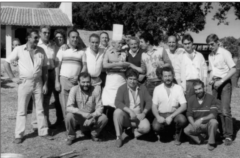
FOTOS PARA EL RECUERDO. Un grupo de amigos en el monte de La Calabaza. Año: 1985. (Comentario en la sección Notas Arandinas).

El contenido de la publicación no refleja necesariamente la opinión del editor.